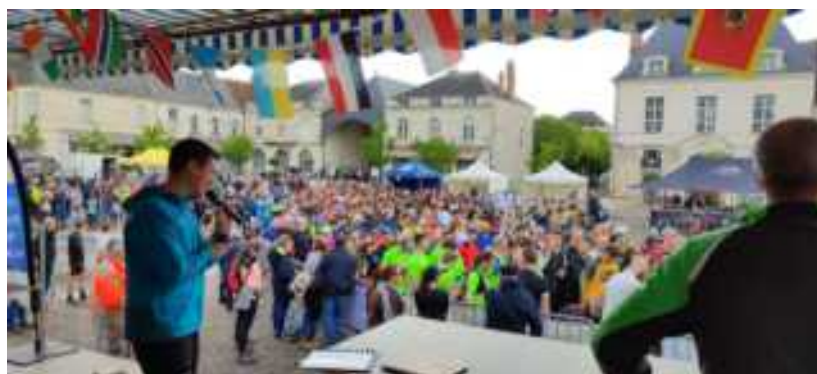
La galopade richelaise

L'association est ouverte à toute personne de plus de 8 ans, qui souhaite pratiquer la course à pied quel que soit son niveau de départ.