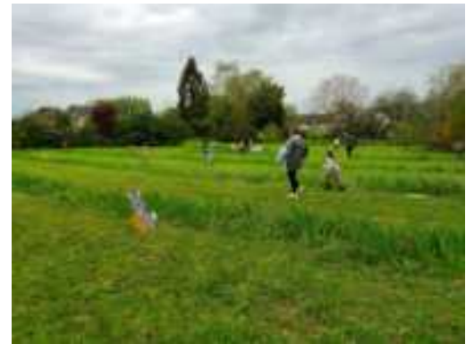
La chasse aux œufs

de vos domaines d'intérêts et de votre temps libre.