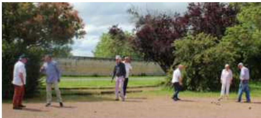
Pétanque au Club des Amis

Le but de notre association est avant tout de vous faire passer de bons moments, en toute convivialité, dans le respect les uns des autres.