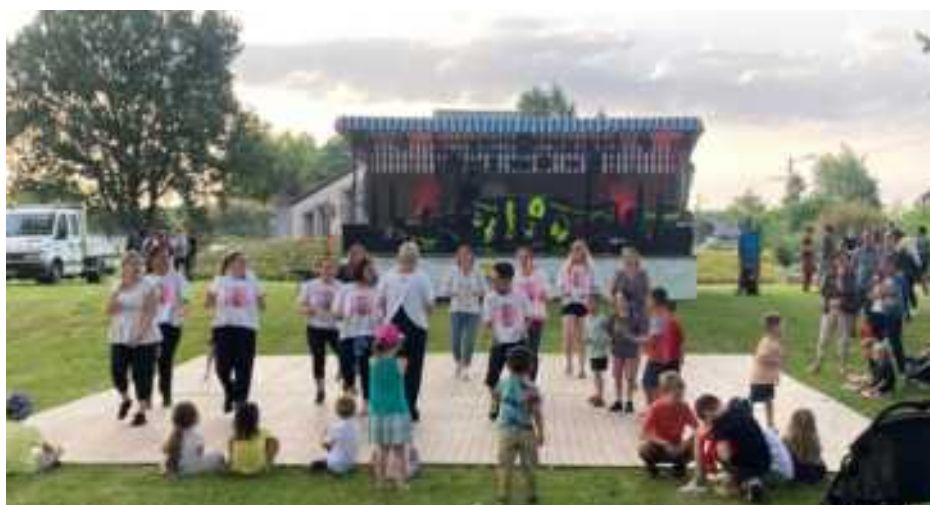
Démonstration de Zumba lors du feu de la Saint Jean

Une feuille d'inscription est à compléter sur place, un certificat médical de non contre-indication est à fournir.