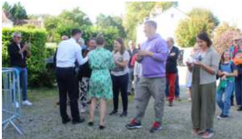
Visite des Bélarus en septembre 2023

L'Association « Champigny, d'Hier à Demain » a pour but de fédérer les Campinois autour d'événements culturels valorisant le patrimoine, l'environnement et les personnalités de notre village remarquable. En 2023, l'Association a enregistré une vingtaine d'adhérents supplémentaires. En partenariat avec la mairie, nous avons reçu une délégation de Bélarus, venue commémorer le peintre Soutine ce qui a donné lieu à la réalisation d'une fresque sur le mur de l'école, à une exposition à la mairie et à des activités de plein air avec nos jeunes élèves. Nous avons organisé avec l'APE, le traditionnel marché de Noël. Nous avons accueilli une troupe de théâtre à la chapelle des Sœurs et des artistes pour un concert lyrique à l'Église. Nous nous sommes rapprochés d'associations sœurs comme « 17è-21è » de Richelieu et avons réalisé des visites privées de nos cités.