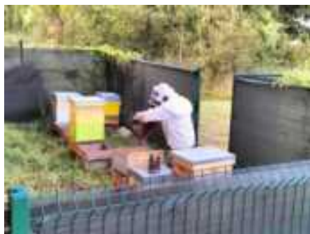
Un "Happy-Culteur" au travail