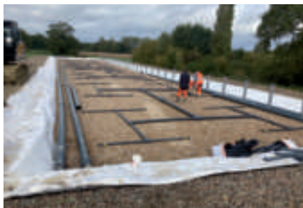
Enfouissement des collecteurs gris pour l'alimentation des bassins.