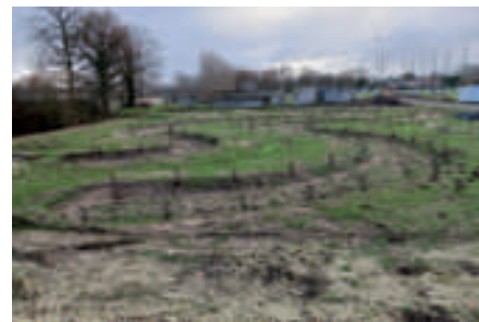
Zone de rejet végétalisée plantée de saules.