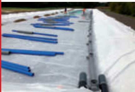
Pose des tuyaux bleus pour l'évacuation de l'eau filtrée.

Les travaux de la station sont toujours en cours.