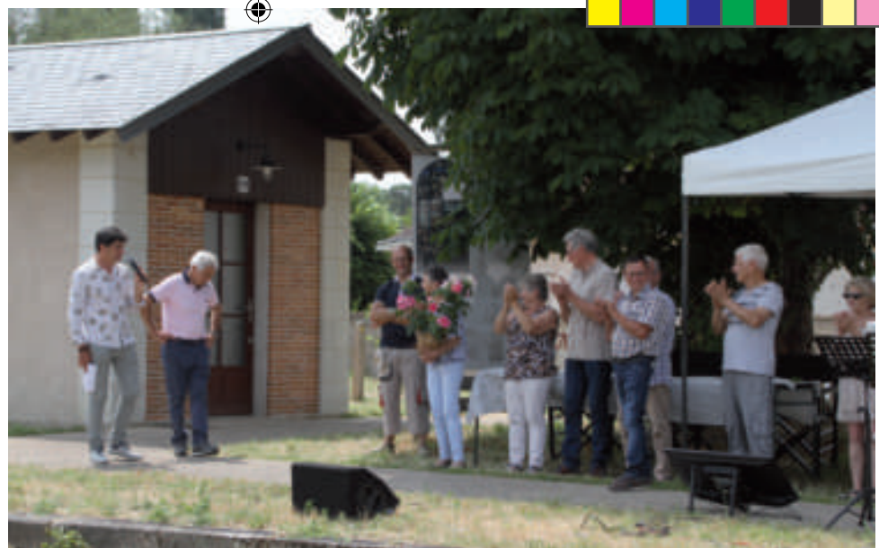
Journée d'inauguration de la Maison des Abeilles .