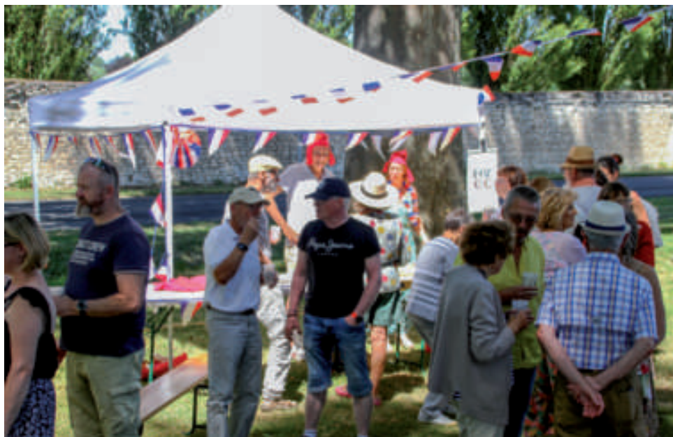
Apéro du 14 juillet.

associations : le marché de Noël, le pique-nique du 14 juillet... Elle favorisera l'organisation d'expositions et d'actions culturelles (pièces de théâtre, conférences, concerts...) dans les nombreux lieux remarquables qu'offre Champigny : nos chapelles, nos maisons, nos jardins, notre salle des fêtes, notre