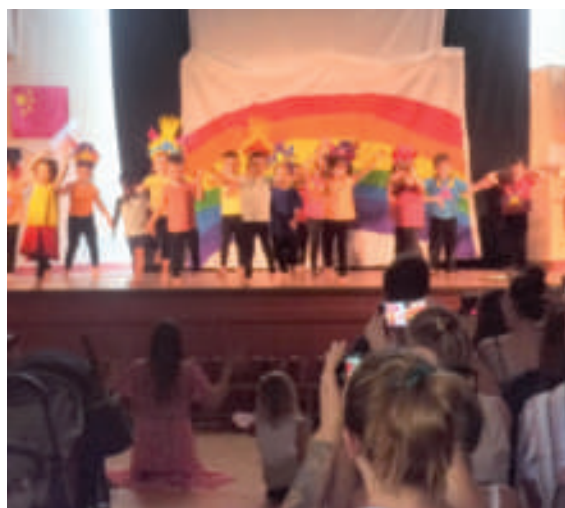
La fête des écoles, un beau succès !