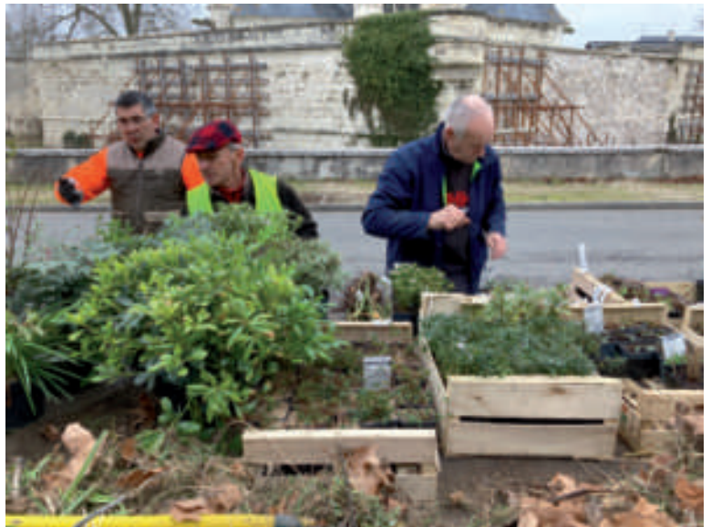
Le fleurissement des rues de notre village.

Dans la prochaine Gazette Campinoise , nous aurons le plaisir de vous détailler ces projets !