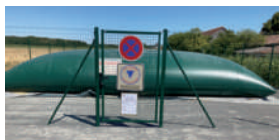
Une des baches incendie aux Puits.