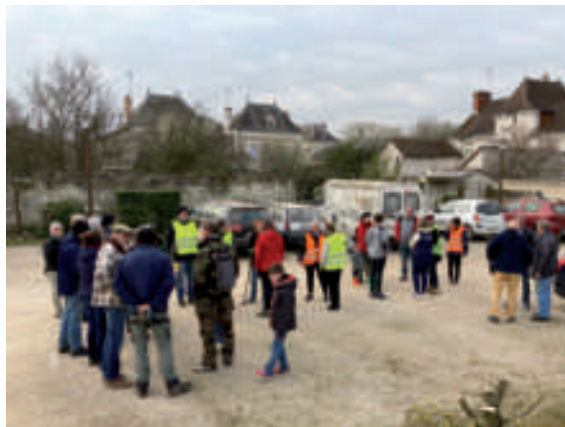
Le grand nettoyage de printemps.