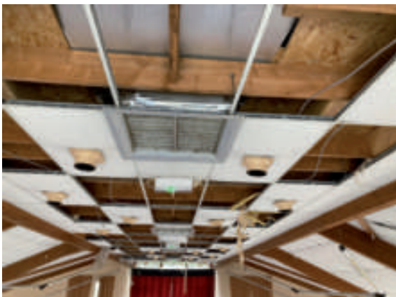
Le Centre Montpensier en cours de travaux.