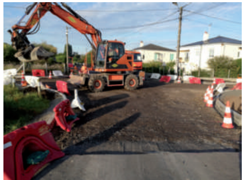
Les travaux rue du Champ de Foire.