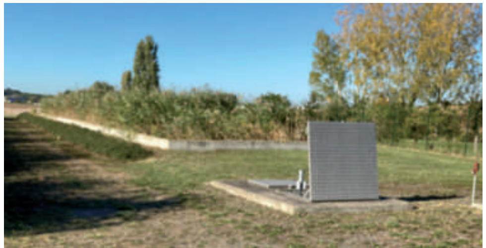
La station d'épuration de Drach .

Notre station d'épuration et une partie du réseau atteignent les 40 ans et commencent à montrer des signes de faiblesse. Plutôt que de s'engager dans des réparations longues et coûteuses, qui ne garantissent en rien la prolongation de vie de la station, un calcul économique sur le long terme, prenant en compte le coût d'investissement et les coûts de fonctionnement ont montré qu'il était préférable de s'engager sur une nouvelle station. Un projet plus écologique et esthétique, comme celui de la commune de Draché, est en cours d'étude. La présentation vous en sera faite lors d'une réunion publique, au premier trimestre 2022.